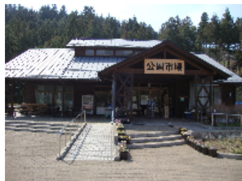
久万農業公園アグリピア

http://www.kumakogen.jp/modules/agripia/