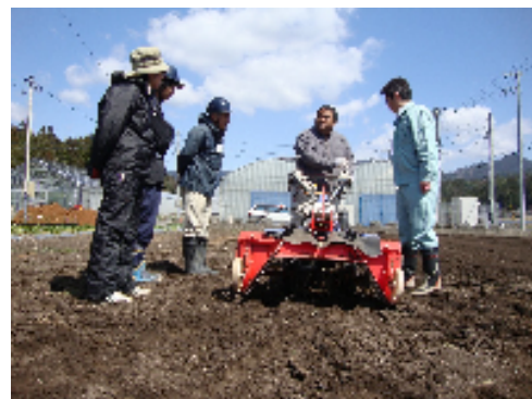
農業機械安全使用講習会の様子

○農用地の利用調整や、担い手確保育成の総合的なサービス機能を持った組織として、農業公社の基幹的事業の支援強化、並びに久万高原町農業の拠点施設として、町営農プランを基に企画・運営機能を十分発揮しながら地域農業の活性化をすすめてきた。