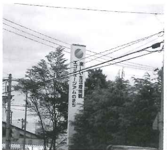
役場前に立つ朝日町エコミュージアムのシンボルマークと基本テーマの看板

朝日町でエコミュージアムをまちづくりになかすようになったのは、町に移住し、山荘経営の傍ら子供たちと共に地域の自然