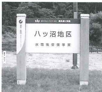
デザイン計画に基づき整備されたサテライトのサイン

また、サインの整備や「創遊館」のオープンなどで視覚的な認識もされるようになり、地元の素晴らしさに気づき、誇りを持