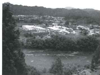
最上川と朝日町市街地

山形県の中央部に位置する朝日町は、面積約197km 2 、 * 人口9,337人、 * 65歳以上の人口が全体の約31%を