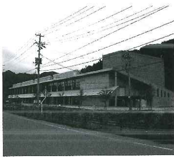
朝日町エコミュージアム コアセンター「創造館」

なって発想、形成、運営することを基本概念に、町固有の生活を楽しみ、町について学び、理解し、誇りを持って