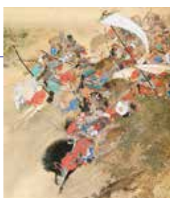
梶田半古 《鶴越》部分 【愛媛県美術館蔵】

内容：えひめ国体・えひめ大会に合わせて愛媛県美術館の所蔵品をメインに、武者絵や刀剣、甲冑などを展示します。