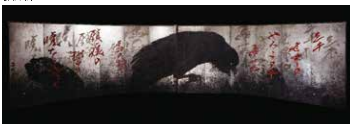
ミラノ国際博覧会2015展示「喰うカラス、喰われるカラス」