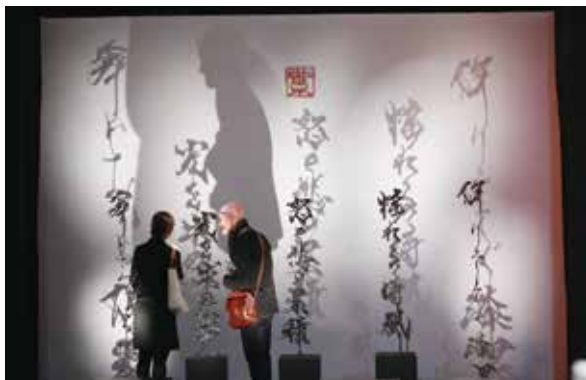
フランス国民美術協会展 審査員証金賞受賞 「舞いおろる陽光 光を求め影 怒と悲の累積 揺れる時風 降りそそぐ漆黒」