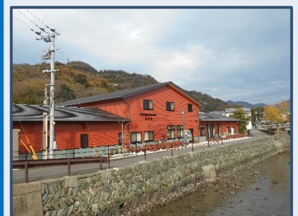
川之石地区交流拠点施設みなせ