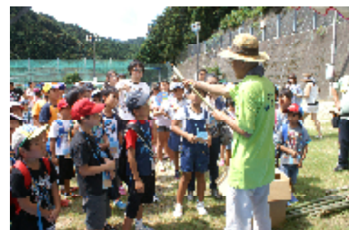
ちびっこ自然体験学校 in 日土東

土の匂い、森の彩り、川のせせらぎ……。ふれあいの山里ひがしでは、人と人との交流を大切なものとしています。地元の人々と触れ合うことで、また、自然と触れ合うことで、心にゆとりを持てる体験を提供します。八幡浜市日土町から繰り広げられる、ふれあいの山里ひがしワールドをご堪能ください。