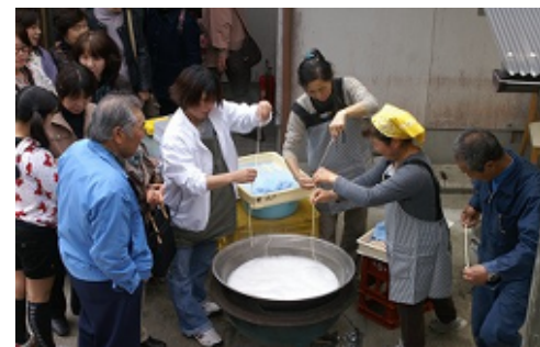
手延べうどん作り体験

各種イベント等の実施により交流人口の拡大はもちろん、地域の認知度が確実にアップしています。また、地域住民に一体感が生まれ、地域の良さを改めて実感する機会になっています。