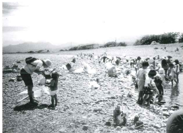
写真 水辺の生き物調べ

コープえひめは、環境に配慮した取組を一層進化させ、今後とも地域社会の中での役割を果たしていきます。』