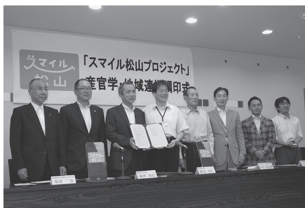
「スマイル松山プロジェクト」産官学・地域連携調印式

1年目のデータ蓄積を踏まえ、2年目には事業拡大と観光商品の開発に着手し、3年目で健診指導を含む ICT による健康サポート、観光商品の発売、健康と防災事業における住民 ID との連携を目指すこととしているものです。本事業の来年度以降の継続性を担保すると共に、健康および観光・防災の仕組みとして構築する「スマイル松山プロジェクト」を先進モデルとして構築を目指して、コンソーシアムを構成する産官学のメンバーをはじめ地域一丸となった推進体制を構築し、松山発の地域課題解決型 ICT 事業として成功させ、健康の増進・高齢化への対応、交流人口の増加という多くの自治体が抱える課題解決に向けて全力で取り組んでまいります。