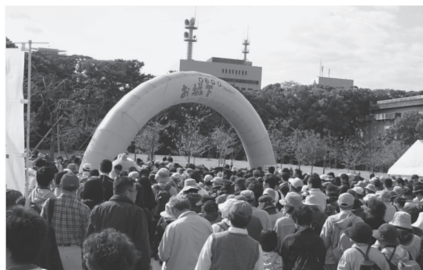
10月26日（土）まつやまお城下ウォーク

モニター（500名）の公募を実施したところ474名の方から申込みがあり、H25年10月1日からH26年1月までの4カ月間に渡り、健康支援・記録ツール「スマイル松山 健康ナビ」を利用して、歩数などのデータを自動で転送できる活動量計を使って、専門家からのアドバイス等をうけながら、チャレンジコース（限定100名）と一般コースに分かれて歩行数の増加・体重の減少に向けてとトライアルをスタートしています。チャレンジコースでは、健康運動指導士による週1回の直接指導が受けられるとともに、一般コースを含めた参加者全員、期間中に開催される松山市主催のウォーキングイベント