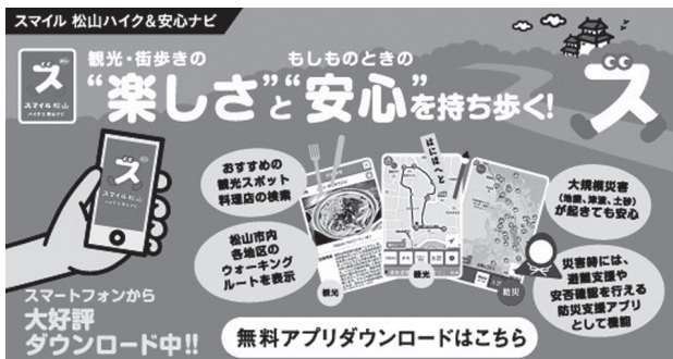
松山市公式アプリ；スマイル松山 ハイク&安心ナビ

ともに、健康 ICT・観光 ICT・防災 ICT のそれぞれにおいて、住民、観光客それぞれとの長期的な関係構築を前提に、ユーザーの情報管理とサポートまでの仕組みを一体的に構築することとしています。