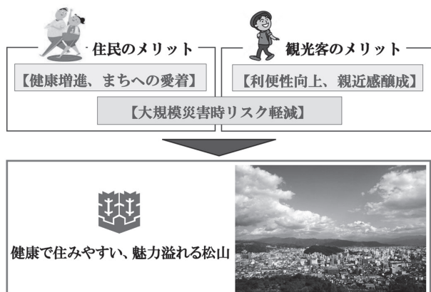
本事業がもたらすメリット

これらのメリットは同様に、同じ課題を抱える全国の他の都市で展開する際にも等しく享受できるものと考えており、県下の市町をはじめとする他の都市においても展開できるプラットフォームとしての機能を構築するものです。