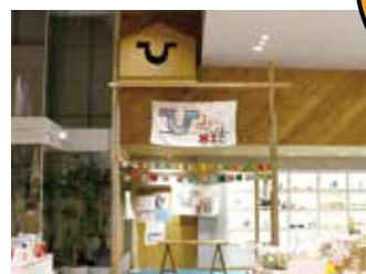
監修・アーティストの日比野克彦氏とともに「ひとりひとりのその人らしさを分かち合う場

所。ひとりひとりとは人とは違うからひとりひとり。その違いは秘密ジャナイけれど大切にしたい私そのもの。」をコンセプトに、道後アート2019・2020を開催しています。プログラムの一つとして松山市道後地区の上人坂エリアに、さまざまな人が集うことができる道後のアート事業の拠点となる「ひみつジャナイ基地」をつくります。基地ができる令和2年5月下旬までは、仮の拠点として道後商店街に「まちなか拠点」を構えています。