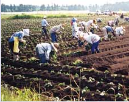
さつまいも植え作業

減り続けていた人口は、この2年で31人増え、314人に。自主財源を確保し、「いずれは自分のことだよ」と、意識の底上げには感動しかない。感動と感謝、自主総参加型の活気あふれる「むら」づく