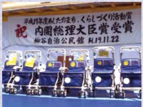
シルバーカー貸与19台