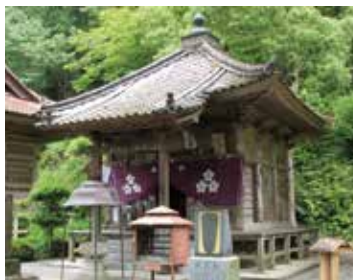
明石寺大師堂(明治13年築)