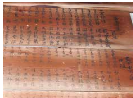
奉寄進板額（岡組・中組・谷組）