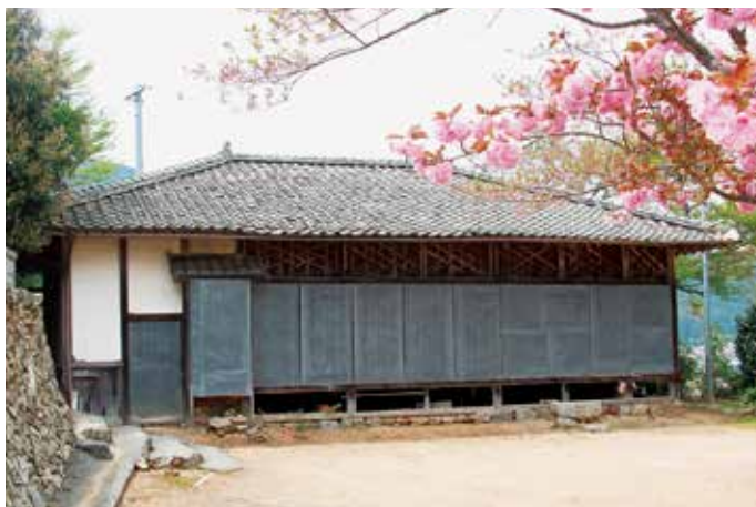
山田大師堂外観('14.4.16撮影)

西予市宇和盆地の石城平野、その最大の溜め池「大池」のほとりに、山田大師堂がある。お大師信仰は、四国の場合言うまでもなく弘法大師だから、八十八ヶ所の札所や遍路道周辺には数多く存在する。 がしかし、この建物は少しその趣きが異なっている。通常は屋根の形が宝形造りと言って、平面が正方形の小堂というスタイルが多く、第43番札所明石寺の大師堂（明治13年築、国登録有形文化財）などはその好例。そうした通例と比較すれば、この大師堂は見ての通り間口六間（約12m）奥行き三間半（約7m）の広い造りとなっていて、屋根も寄棟形式である。