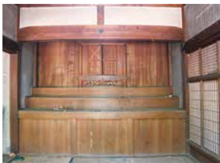
大師像が安置されている祭壇

西予市宇和盆地の石城平野、その最大の溜め池「大池」のほとりに、山田大師堂がある。お大師信仰は、四国の場合言うまでもなく弘法大師だから、八十八ヶ所の札所や遍路道周辺には数多く存在する。 がしかし、この建物は少しその趣きが異なっている。通常は屋根の形が宝形造りと言って、平面が正方形の小堂というスタイルが多く、第43番札所明石寺の大師堂（明治13年築、国登録有形文化財）などはその好例。そうした通例と比較すれば、この大師堂は見ての通り間口六間（約12m）奥行き三間半（約7m）の広い造りとなっていて、屋根も寄棟形式である。