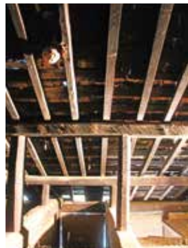
屋根裏(チョウナ削りの跡もくっきり)

る。肝心のお大師様が祀られている場所は、正面右側の四分の一、一間半相当にしか過ぎない。建築的には実に簡素、全体としては実に素朴な建物だが、重要なのはその広さにある。それは何故なのか、何とかその理由に迫ってみよう。