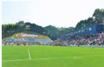
ありがとうサービス・夢スタジアム

5000人収容のスタジアムが超満員となり、スタジアム前のイベント広場では、バラエティに富んだ飲食スペース、子供たちが楽しめるアトラクション、インスタ映えする撮影スポットなど、サッカー以外にも楽しんでいただける一日となりました。 スタジアムビジョンは、「そこにいる全ての人が、心震える感動、心踊るワクワク感、心温まる絆を感じられるスタジアム」。 クラブの経営理念である、「次世代のため、物の豊かさより心の豊かさを大切にする社会創りに貢献する。」を実現するため、夢スタを通して今治に多くの人が集まり、多くの感動を共有していただけるよう、取り組んでいきます。