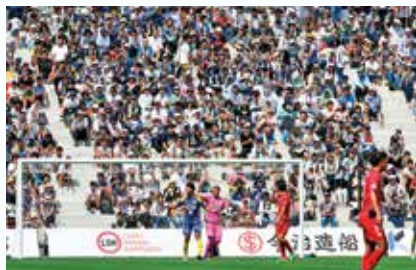
9月10日対ヴェルスバ大分戦

長く、1976年に発足された「大西SC」から「今越FC」「愛媛しまなみFC」、そして現在J2に所属する愛媛FCの傘下のアマチュアチーム「愛媛FCしまなみ」の活動を経て今に至るため、約40年の活動期間を有しています。 昨シーズンは、地域リーグから悲願の「JFL」昇格を果たし、全国を舞台として熱い戦いを繰り広げています。 9月10日、いよいよFC今治のホームスタジアム「ありがとうサービス・夢スタジアム」(通称「夢スタ」)がこけら落としを迎えました。