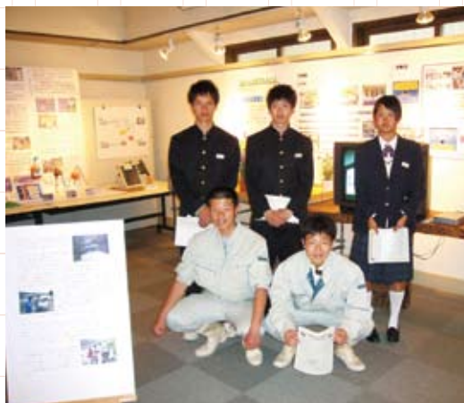
故郷の水を守る展示会の開催

置している。これらの濾材は、地元産業、農家から出る自然廃棄物。農村特有の環境問題を農業の力で解決したい。こうした思いに地域も共感し、小学校、婦人会、各種組合、生活改善グループの協力を得て、地域一体となつて広見川浄化活動に取り組んでいる。 そんな、故郷を守るKZFの取組には、県境を越えた高知県からも大きな期待が寄せられている。高知県清流環境課主催の協議会や学会において、河川浄化の実践研究として招待を受け、研究内容を発表している。また、高知県立四万十高等学校や高知工科大学と共同プロジェクトを進めていくことになり、連携の輪が広がっている。