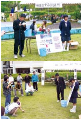
水質浄化講座の実施

高校生として自分たちにできること「地域に研究成果を還元したい」そんな思いがKZFには詰まっている。その一つが、水質浄化処理装置の開発である。 鬼北町は、椎茸が盛んに生産されている。その椎茸の収穫後のホダ木には、窒素を分解する微生物が多く住み着いている。また、南予地方は、真珠生産が全国有数の水揚げ量を誇る。問題は、真珠水揚げ後のアコヤ貝の始末。このアコヤ貝には、過剰なリンを吸着する働きがある。さらに、森林の町でもある鬼北町では、放置竹林が問題になっている。その放置竹林を利用し、竹炭を生産する。竹炭には、有機物や界面活性剤を吸着する働きがある。 こうしたホダ木、アコヤ貝、竹炭を用いて川の水を濾過し、浄化する水質浄化処理装置を作り、広見川に注ぐ生活排水溝に設