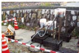
生活排水溝に設置した水質浄化装置

境をつくるのが大切だと思う。そして、環境づくりとは、きつと人づくりなんだ」と。それは、水質浄化処理装置の開発や地域との連携など、何も無いものから新しいものを作っていくたり、そこに息づく人々や交わる人々を「作る、育む」ことが、環境保全で最も大切であると実感したからだ。私は思う。その人づくりは生徒自身にも当てはまる。彼らが多くの人々、地域との交わりの中で、試行錯誤し励まし支えてもらいながら、冒頭で紹介した「人間力」の向上に繋がっていったのを… 環境を守るため、農業高校生として何が出来るかと考え、立ち上がった彼ら。美しい景色がいつまでも残ることを願い、地域の仲間と共に、最後の清流を支えるべく、情熱を傾けている。