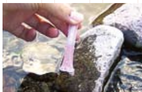
パックテストによる水質調査