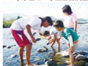
小学生との水生生物調査

境をつくるのが大切だと思う。そして、環境づくりとは、きつと人づくりなんだ」と。それは、水質浄化処理装置の開発や地域との連携など、何も無いものから新しいものを作っていくたり、そこに息づく人々や交わる人々を「作る、育む」ことが、環境保全で最も大切であると実感したからだ。私は思う。その人づくりは生徒自身にも当てはまる。彼らが多くの人々、地域との交わりの中で、試行錯誤し励まし支えてもらいながら、冒頭で紹介した「人間力」の向上に繋がっていったのを… 環境を守るため、農業高校生として何が出来るかと考え、立ち上がった彼ら。美しい景色がいつまでも残ることを願い、地域の仲間と共に、最後の清流を支えるべく、情熱を傾けている。