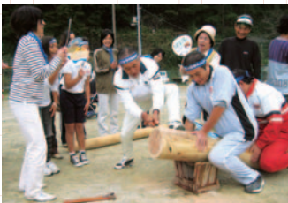
競技「与作」に出場の全日本選抜チームの選手と応援団

運動会を行って感じて感ずることは、朝は見ず知らずの人同士ですので一体感はありませんが、種目が進むにつれ親近感が湧き、最後のリレー種目などは自分のチームの選手を一生懸命応援する姿が目立つようになります。そして一緒に何かを達成した喜び、心地よい汗、疲れを感じながら「来年は最下位を脱出するで！」と約束し帰って行く姿がとても印象的でした。(19年度は10月28日に実施予定)