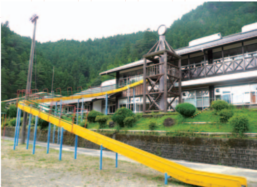
2階の教室から運動場に飛び出せる「魚梁瀬小学校」

この地区は昔から林業を中心に栄えましたが、木材不況や営林署再編の影響で過疎化が急速に進行しました。昭和61年には485人だった地区の人口は現在では220人にまで減少しました。子どもの数も同様に減少し、魚梁瀬小・中学校の存続が危ぶまれるように