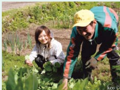
夫婦で仲良く農作業

これから農村で生活していくためには、ただ農業をやるだけではなく、たくさんある農村地域の資源と、様々な都市のニーズ、人や組織等を様々な形でつな