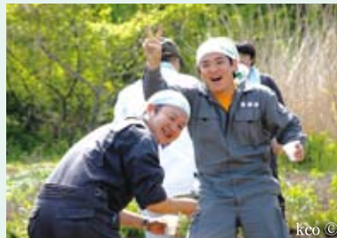
笑顔がいっぱい！えがおファームにて

短大卒業後、私は横浜で会社員をしていたが、22歳の時に以前から関心があった国際協力の仕事をするため、民間団体の紹介でタイに渡り、2年半住んでいた。タイの農村地区で、村の人と寝食をともにしながら農業をする中、先進国の求めに応じて、換金作物を大量に生産したり、本来とは違う時期に収穫できるよう栽培したりするために、大量の農薬や化学肥料を使い、自然に反する農業をしている実態に直面した。最初は、タイの