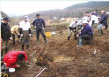
木の根 vs 男9人

私が初めて来た時、この集落の農地の約7割が遊休状態で、ススキや木が生え荒れていた。